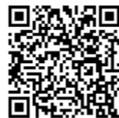
汽车与工程 机械学院 微信公众号

2、汽车与工程机械学院： 2023级新同学，欢迎关注微信公众号 @ 广交汽机学院，了解汽机学院丰富有趣的学生活动，并在公众号后台留言你们心中憧憬的大学生活是什么？现邀请你参加2023级“萌新自我介绍”活动，发送照片+200字以内文字自我介绍，或者一段3分钟内的自我介绍视频，我们将会在学院微信公众号上分享部分投稿作品并赠送有纪念价值的小礼品，想让老师和同学们提前认识你的小萌新请将素材8月30日于前发到指定邮箱 302786032@qq.com，期待与你们的初次见面。