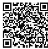
智慧交通工程学院 微信公众号

8、智慧交通工程学院： “智”等你来，遇见美好：2023级新同学，欢迎关注公众号“广交智慧交通学院”，该公众号将为大家开启“智慧萌新”活动专栏。同学们自收到录取通知书起，打卡萌新与通知书合照，并附上200字以内的“大学希望”，即可有机会参与公众号推文头条，凡被“广交智慧交通学院”公众号发布者即可获取“智慧萌新”开学礼一份，欢迎投稿至：wyhuang@gdcp.edu.cn。期待你们的到来！